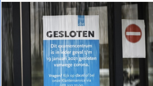
Figuur 3 RTL Nieuws (2021)

Uit recent onderzoek blijkt ook dat de coronapandemie invloed heeft gehad op de lage toestroom van nieuwe vrachtwagenchauffeurs (NOS, 2021). Door de pandemie hebben de rij scholen maandenlang stilgelegen en zijn de rijexamens bij het CBR uitgesteld. Mannen of vrouwen die de ambitie hadden om vrachtwagenchauffeur te worden, konden dus niet hun rijbewijs halen en hebben tijdens de pandemie wellicht een nieuw beroep gevonden.