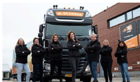
Figuur 4 AD (2019)

Er moet voor dit probleem in Nederland dus een andere oplossing komen. Volgens De Weerd (2021) zijn vrouwen de